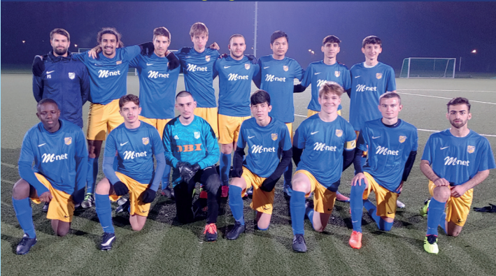
A-Junioren 2022/2023 Jahrgänge 2004 / 2005

Training: Mittwoch 18:30 bis 20:00 und Freitag 18:00 bis 19:30 Ansprechpartner: Patrick Swolana 0176/63 39 62 07