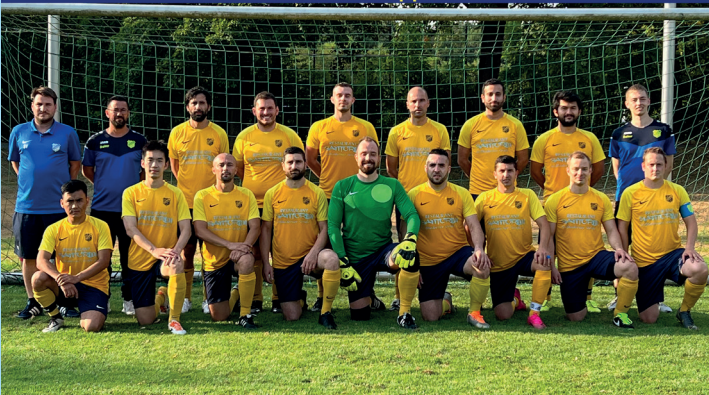
Erste Mannschaft 2022/2023 A-Klasse Gruppe 3

Training: Mittwoch 19:30 bis 21:00 Uhr, Freitag 19:00 bis 20:30 Uhr Ansprechpartner: Basti Vodermayer 0171/772 55 67