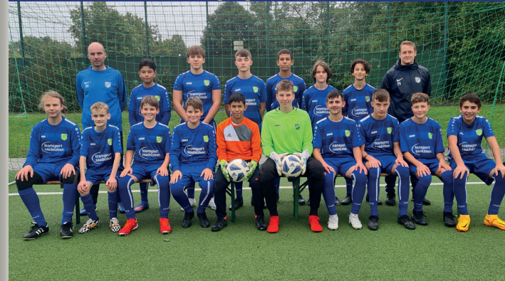
C1-Junioren 2022/2023 Jahrgang 2008 - 2009