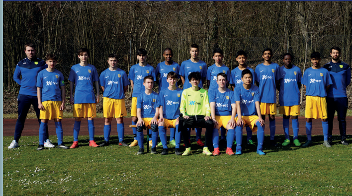
B-Junioren 2022/2023 Jahrgänge 2006 / 2007

Training: Mittwoch 18:30 bis 20:00 und Freitag 18:00 bis 19:30 Ansprechpartner: Patrick Swolana 0176/63 39 62 07